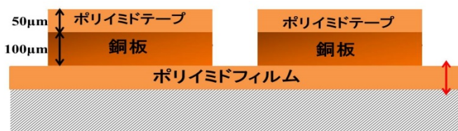
Fig.1 Imitation solar array coupon.

本研究では太陽電池クーポンに使用してある絶縁フィルム（ポリイミドフィルム）の厚さを変えることで持続放電が起きてから基盤に短絡するまでの時間（絶縁破壊時間）を測定しそれぞれの厚さの評価を行っている。